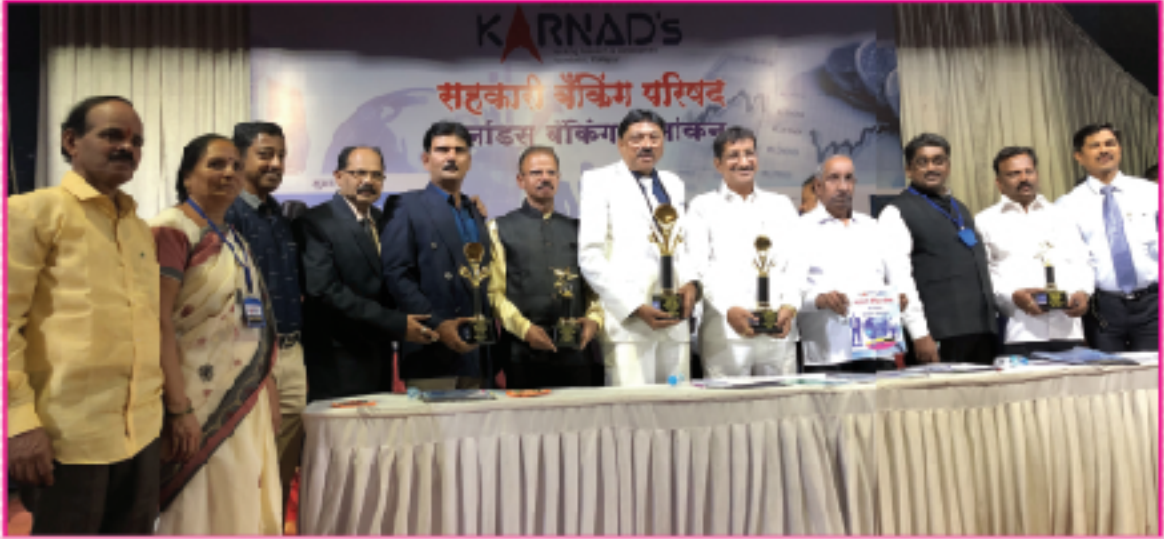
कर्नाड्स बँकिंग रिसर्च अँड डेव्हलपमेंट फाऊंडेशन, कोल्हापूर या संस्थेकडून बँकेला १) सर्वोत्तम मुख्यकार्यकारी अधिकारी २) सर्वोत्तम विशेष वसुली अधिकारी ३) आर्थिक सक्षम आणि उत्तम व्यवस्थापन असणारी बँक ४) शुन्य टक्के एन.पी.ए. असणारी बँक ५) अद्यावत सुविधा देणारी बँक असे विविध मानाचे पाच पुरस्कार स्विकारताना बँकेचे अध्यक्ष, उपाध्यक्ष, संचालक मंडळ सदस्य, मुख्यकार्यकारी अधिकारी, सहाय्यक व्यवस्थापक, लेखापाल, आय.टी.अधिकारी व अधिकारी वर्ग